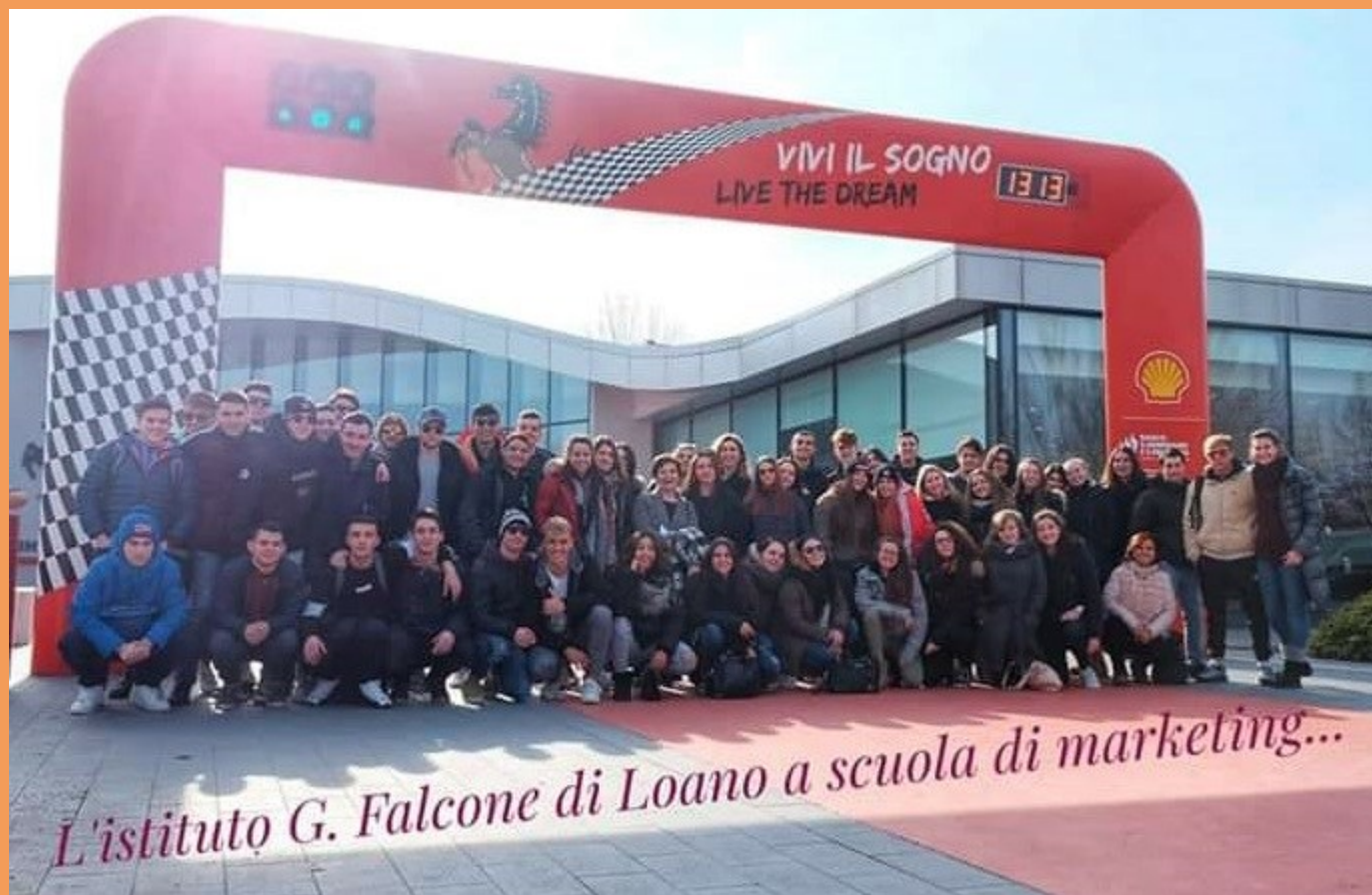
A scuola di marketing a Maranello!