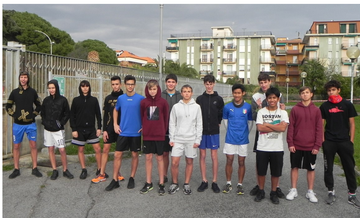
Partecipanti gara maschile