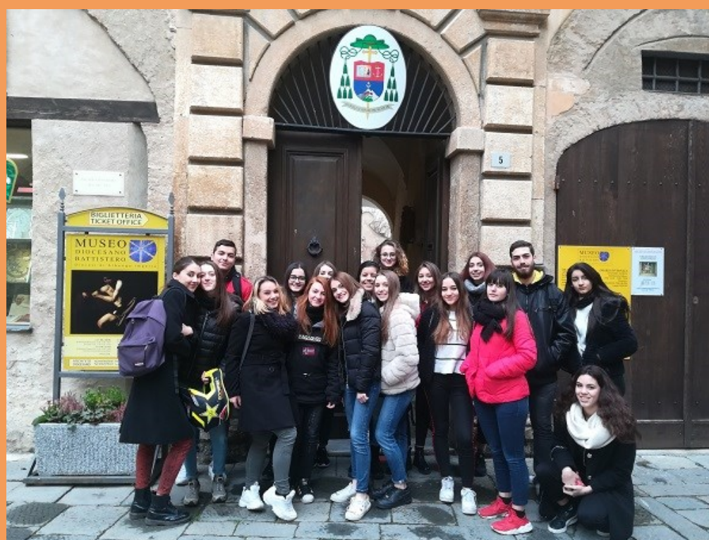
Progetto Turismo Attivo Museo Diocesano di Albenga