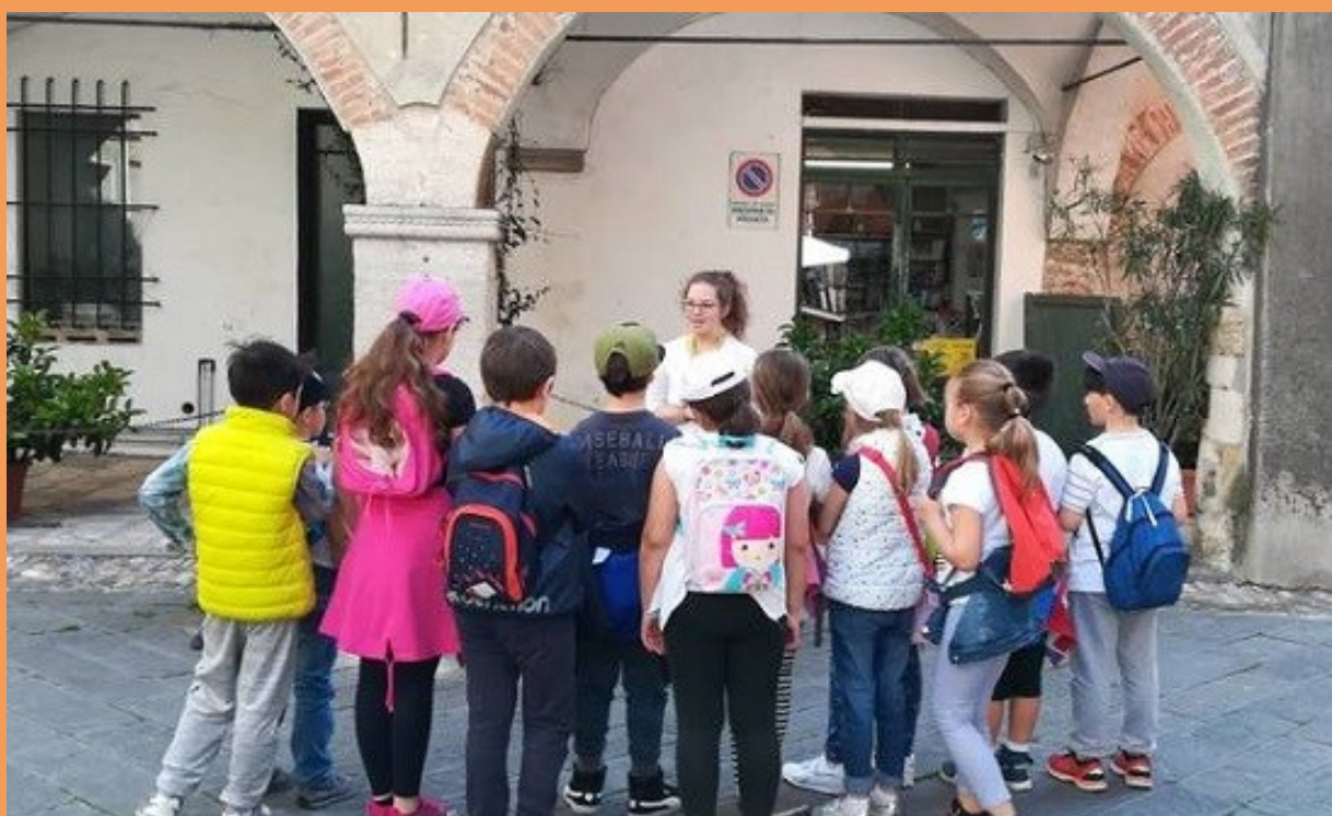
Alternanza Scuola—Lavoro : Guide turistiche per le scuole