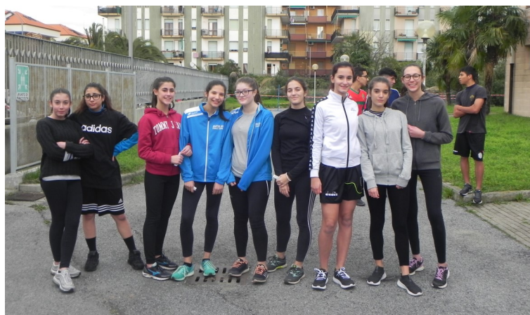
Partecipanti gara femminile