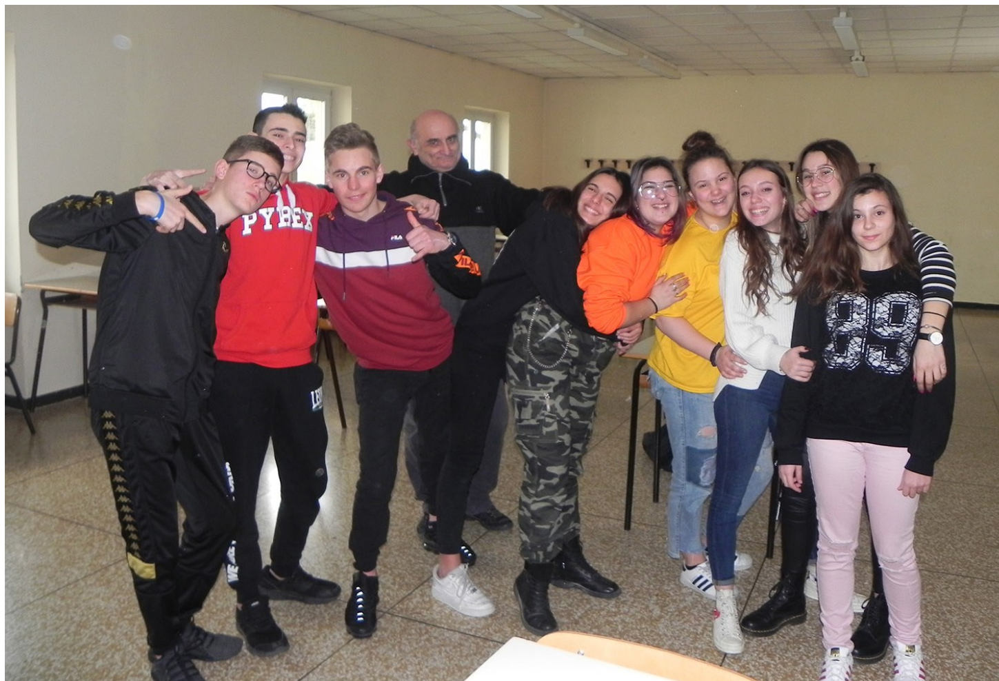
I ragazzi del Laboratorio teatrale del Falcone

N.S.: Il messaggio che vogliamo dare è che sono esistiti ed esistono ancora oggi persone che sono capaci di sacrificare se stessi per raggiungere il beneficio di tutti.