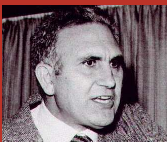
PIO LA TORRE