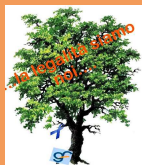
LOGO LABORATORIO "LA LEGALITA' SIAMO NOI"